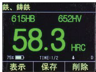
3スケール同時表示

標準表示、3スケール同時表示、グラフ&3スケール同時表示の3種類の表示機能を搭載しています。